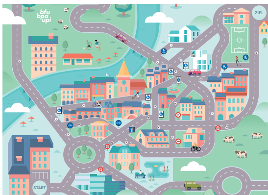
Engins électriques Sur le bon chemin

Cinq tableaux magnétiques montrent différentes situations dans le trafic routier. Dans le cadre d'un concours, des figurines magnétiques représentant une voiture, un piéton ou un cycliste sont utilisées pour déterminer l'ordre de priorité.