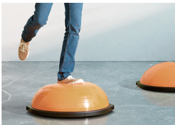
The Coffee Cup Améliorer son équilibre en s'amusant

Le BPA a élaboré des outils ludiques destinés à transmettre aux collaboratrices et aux collaborateurs des connaissances générales et des conseils de prévention en lien avec un certain type d'accident.