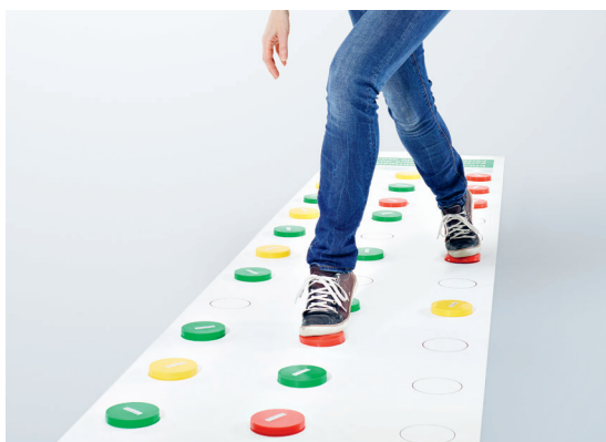
Parcours d'équilibre Prévenir activement les chutes

La stabilité, l'équilibre et la force sont nécessaires non seulement pour pratiquer de nombreux sports, mais également pour prévenir les chutes au quotidien. Ce sont exactement ces trois aptitudes que le jeu «The Coffee Cup» permet d'entraîner.