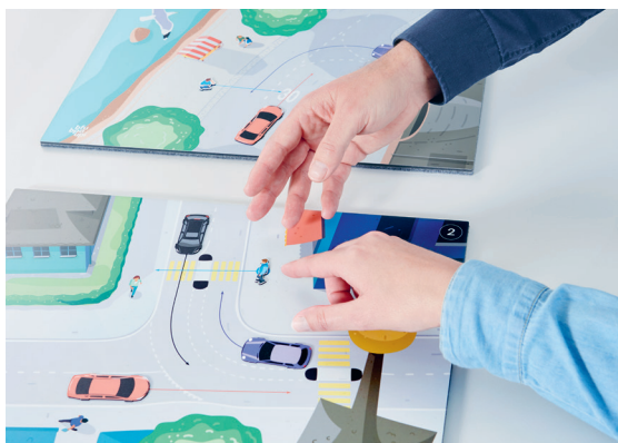
Qui est prioritaire? Prévenir les accidents de la route

Un parcours offre aux collaboratrices et aux collaborateurs la possibilité d'entraîner leur équilibre. Il existe en trois niveaux de difficulté, qui se distinguent par la longueur et la séquence des pas à effectuer.