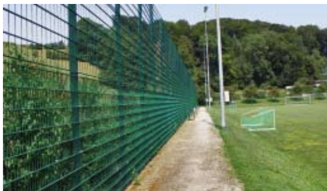
Grillage en acier