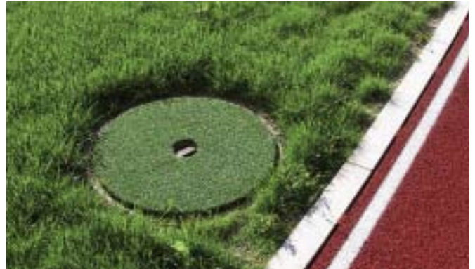
Regard recouvert de gazon artificiel

Il faut si possible éviter d'encastrer des douilles dans le gazon. Les arroseurs escamotables doivent être aménagés à niveau et recouverts de gazon artificiel.