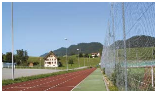
Zone de sécurité le long d'une piste