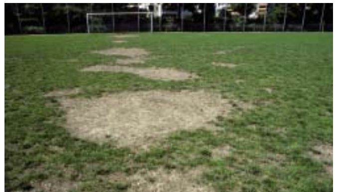
Les inégalités de terrain peuvent causer des blessures.