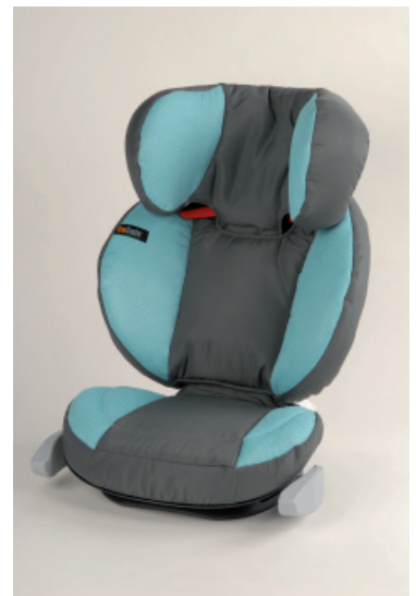
Il progresso tecnologico è inconfondibile: a sinistra un prodotto del test dal 1968, a destra un rialzo sedile con lo schienale del anno 2009.